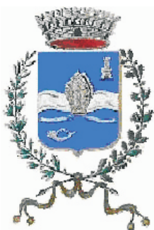
Comune di La Cassa