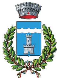
Comune di Givoletto