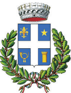
Comune di San Gillio